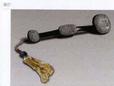
玉雕登科狮象红木如意 清嘉庆 玉、红木 如意长49.5厘米 1973年整理征集【吴江博物馆】