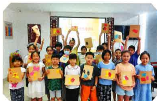
“传统文化进社区”系列教育实践活动

今年，推进多维协同，拓宽教育实施广度，社会教育活动不断创新，共举办讲座、活动16场。一是新春活动相聚云端，开展“留吴过年”惠民活动，如“丑牛接寅 虎虎生威”新春线上灯谜、“虎年画虎 萌娃迎新”绘画作品征集、“暗香梅影 锦绣芳华”线上绣春等，吸引506名市民群众线上参与。二是围绕“5·18国际博物馆日”主题，举办“近现代吴江本土名人选述”、“吴江口袋宝”、“文物“食”尚秀”等线上讲座及社教活动。三是暑期围绕“传