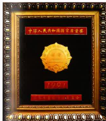
“中华人民共和国国家质量奖”金质奖