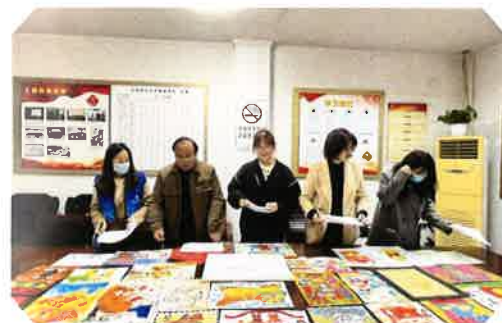
“虎年画虎 萌娃迎新”绘画作品征集