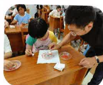
韦老师指导学员拓印