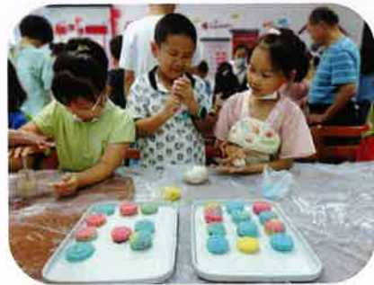
孩子们积极参与活动

“无云世界秋三五，共看蟾盘上海涯”。在这一年一度的中秋佳节时，吴江博物馆走进社区，举办“冰皮月饼DIY”中秋主题活动，与社区居民共度佳节，21组亲子家庭参加此次活动。