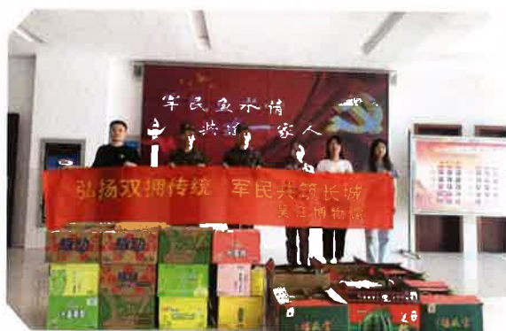
开展双拥慰问活动