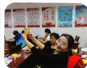
居民展示亲手制作的“水晶杯垫”