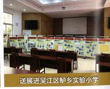
送展进吴江区鲈乡实验小学