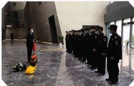
消防安全知识培训