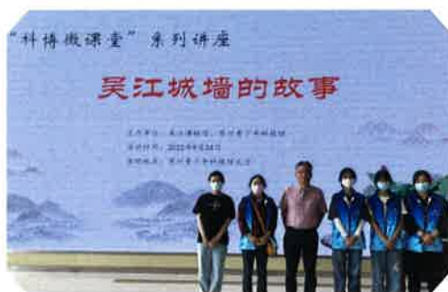
科博微课堂之《吴江城墙的故事》

承传统文化 弘扬美学精神”主题，分别走进社区、乡镇、企业开展“传统文化”系列教育实践活动，展示与传授“拓印、剪纸、吟诵、篆刻、印刷”等非遗技艺。四是深化“我们的节日”主题，创新互动课程，春节、中秋、国庆、重阳等节日开展“冰皮月饼DIY”活动、“双节同庆贺 喜迎二十大”等主题活动。五是通过馆校合作、馆馆联合，共话文博小课堂，走进吴江区八坼小学、苏州青少年科技馆，开展“吴江口袋宝”传播活动《文物里的吴江》、科博微课堂之《吴江城墙的故事》等讲座。今年，吴江文博志愿社新招募10名志愿者新生力量，将继续为打造一支有特色、有活力的文博志愿服务队伍而努力。