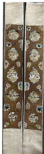
清 盘金地开框人物纹挽袖