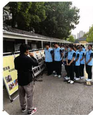
在吴江实验初级中学为学生讲解《费孝通和江村的故事》

为坚定文化自信，使更多的文化资源与群众共享，以更优的供给服务群众。今年，开展“强国复兴有我”群众性主题宣传教育活动；配合“文艺轻骑兵 吴江服务行”送展活动，选送《吴江革命历史回顾展》、《鲈乡风韵——吴江老照片展》、《费孝通和江村的故事》，将送展活动延伸至全区基层一线，展览范围包含各区镇学校、社区和企业，讲解员提供上门讲解服务共计46场次。