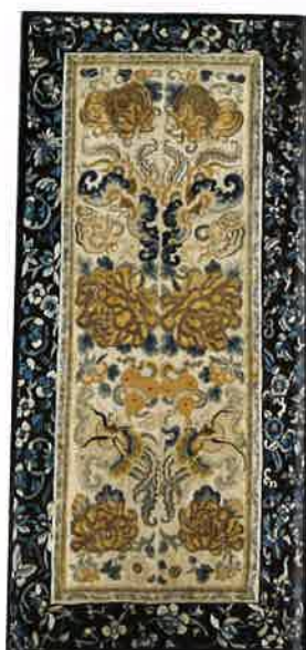
清 盘金打籽绣瓜瓞绵绵挽袖