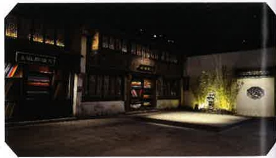
苏州湾博物馆历史展厅