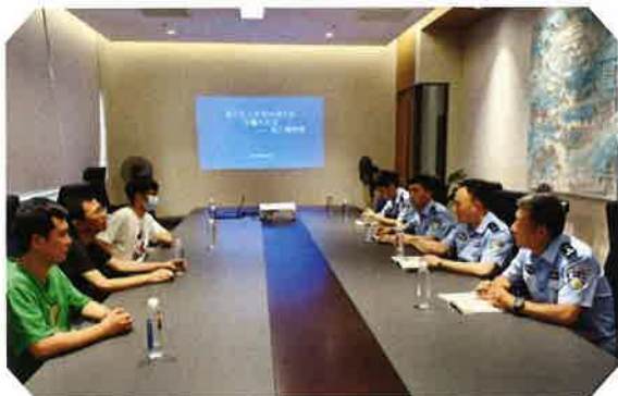
吴江区公安专项安全检查现场会议