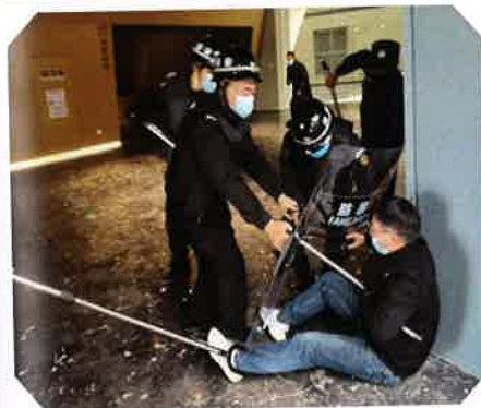
防爆实操技能演练

安全保卫部以内部保卫重点单位为工作推动力，针对安全防范工作中的要点，结合上级对安全防范工作的部署和要求，通过安全工作例会、安全技能培训演练，分析和解决在安全防范工作中存在的不足，有计划地开展技能提升培训，今年共举办安防演练2次，切实提高博物馆工作人员遇到紧急情况时的快速反应协调能力，做到反应迅速、处置果断，最大限度地减少突发事件的危害性，确保观众、员工、文物的安全。