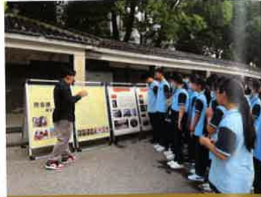
送展进吴江区实验初级中学