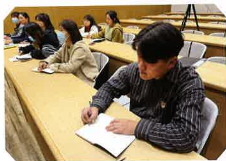
讲解员认真做笔记