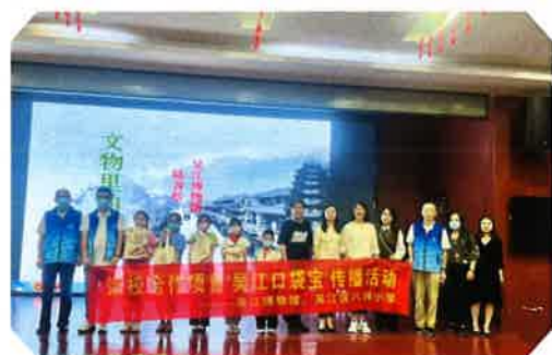
“吴江口袋宝”传播活动——《文物里的吴江》