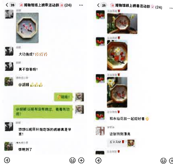
学员在线交流刺绣心得

2022年2月5日—2月16日，吴江博物馆开展“暗香梅影 锦绣芳华”线上绣春活动，工作人员将材料邮寄给市民，共有20名市民参与活动。参加刺绣活动的市民大部分是初次尝试，博物馆宣教老师通过视频，让学员了解到长短针绣与结粒绣的针法，以及花朵颜色如何渐变等。在绣春活动微信群中，大家积极交流、讨论，几天后，学员纷纷展示了自己的作品。