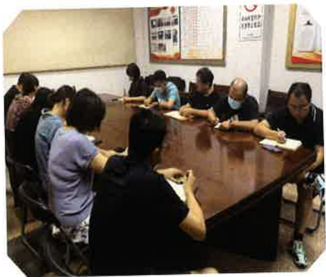
节前安全工作会议

强化安全责任机制。抓好防范保安全，强化责任是关键。安全保卫部按照馆长室要求，严格落实主管人员负责制，把目标管理摆在重要位置，层层签订安全责任书，强化责任和参与意识，定期研究部署安全保卫工作，经常开展安全检查，时刻注意掌握管理区域内的安全动态，及时解决工作中存在的问题。利用每月安全工作例会和节前安全工作会议等机会，坚持安全常识学习和教育，安保人员还要单独进行安全保卫方面的技能训练和安全知识的学习，使全体保卫人员对安全防范的严峻性、必要性有一个清醒的认识，增强忧患意识和紧迫感，克服麻痹和侥幸心理，警钟长鸣。