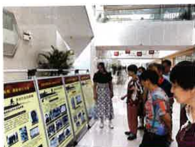
送展进松陵街道（湖滨华城社区）

为展示新时代伟大成就，凝聚新征程奋进伟力，为党的二十大胜利召开营造浓厚氛围，吴江博物馆在2022下半年开展“喜迎二十大”流动博物馆送展活动，分别向中小学、社区、企业等单位送展。通过流动展览的形式，引领广大市民和学生沉浸式感受新时代伟大成就，不断增进对党和社会主义祖国的朴素情感。