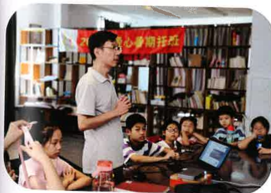
老师介绍雕刻历史