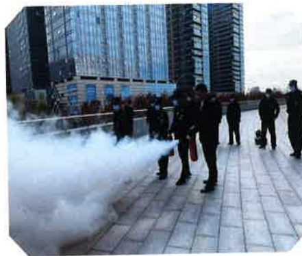
消防安全实操培训

吴江博物馆是二级消防安全重点单位，安全保卫部扎实开展消防安全“四个能力”建设，定期组织消防安全培训及消防安全技能操练，加强安保工作人员的消防安全责任意识，提升人员的安全防范和应急处置能力。切实开展消防安全巡查工作，以每日岗位巡逻为基础，部门检查为依托，以每月联合检查为总评，对检查中发现的安全隐患，及时落实处置解决，对确实不能在短时间内解决的，制定整改措施，限期改正，对于各类安全隐患都争取消灭在萌芽状态，切实按照相关要求做好消防安全工作。