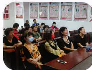
社区居民参与活动

2022年9月30日下午，吴江博物馆工作人员走进吴江区松陵街道奥林清华社区，开展“双节同庆贺，喜迎二十大”主题活动，20多位社区老年居民及志愿者参加此次活动。