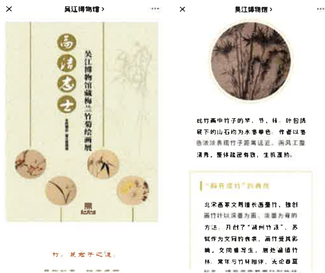
文房风雅——古代文人的雅室闲情

4、高洁之士——吴江博物馆馆藏梅兰竹菊绘画展（1-4期） 梅兰竹菊分别寓意傲、幽、坚、淡的理想人格，作为历代文人感物喻志的象征，成为了诗词和书画中最常见也是最经典的主题。我馆从馆藏书画中挑选出描绘“梅”“兰”“竹”“菊”的精品绘画，分别进行专题线上展览，通过绘画作品感悟古代文人所向往的高洁品德。