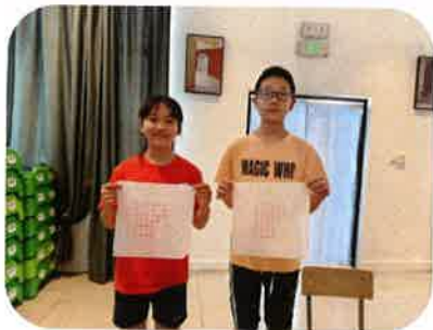
同学们齐心协力共同完成古诗印刷

活动中，谈老师讲述了关于吴江的两首古诗，张翰《秋风歌》及陈尧佐《吴江》，讲解两首古诗词的独特意境及人文意趣，同时，谈老师还给同学们科普了活字印刷术的发展及贡献。在老师的指导和演示下，同学们共同协作，运用活字印刷工具进行印刷，充分感受到古代印刷术的魅力。