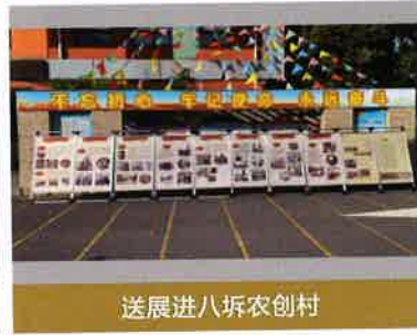
送展进八厝农创村