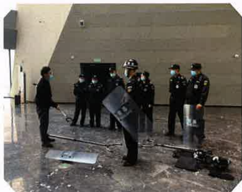
安全防范知识培训

吴江博物馆认真贯彻落实习近平总书记关于文物安全工作和安全生产工作的重要指示批示精神，坚持“预防为主、关口前移、主动作为、防消结合”及谁主管、谁负责”的原则，落实安全责任，加强安保人员安全培训与技能训练。今年共组织安全大检查12次、周检查52次、安全工作会议12次。保安人员及部门工作人员做好每日岗位巡查，积极做好安防、消防维保；严格配合疫情防控要求，每日进行职工体温监测和双码查验，对公共区域和办公区域进行全面的环境消杀，守护好场馆环境卫生与安全。