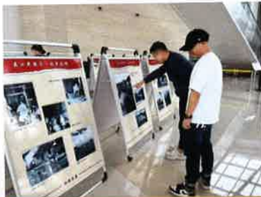
送展进汾湖高新区管委会