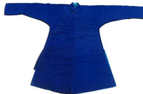
民国 蓝色斜襟夹袄