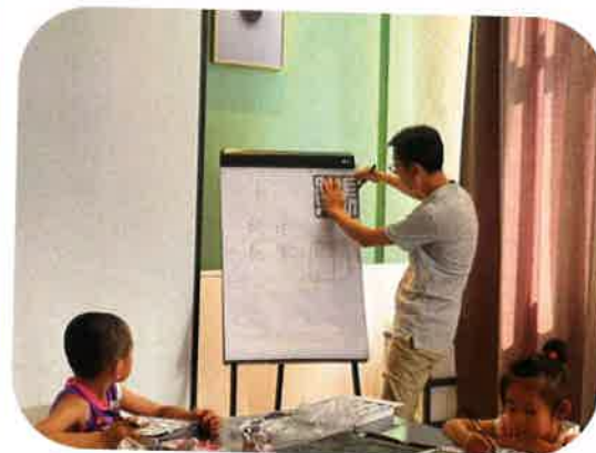
老师教授篆刻技艺