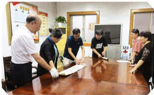
8月1日，苏州市文物保护鉴定委员会专家对馆藏文物进行定级鉴定