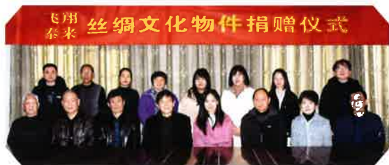
丝绸文化物件捐赠仪式

为进一步坚实展陈文物基础，今年年初，接收泰来进出口有限公司及吴江飞翔印染有限公司捐赠的56件（套）丝绸文化物件并举行捐赠仪式。接收个人捐赠民国蓝色斜襟夹袄1件及竹箬1件。全力配合区文体广旅局文物科开展同里、平望考古勘查，接收同里墓砖130余件。向苏州文物商店征集任熊人物扇页、缂丝宝相花方片、盘金打籽绣瓜瓞绵绵挽袖等共7件书画和丝绸藏品。完成新征集文物247件（套）的定级工作，确定三级文物149件，其中拟推二级26件。同时做好全省可移动珍贵文物备案复核。