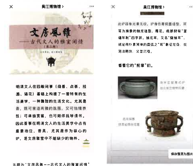
文房风雅——古代文人的雅室闲情

3、文房风雅——古代文人的雅室闲情（1-4期） 古代文人好文擅艺，书房中的各种摆件，与“文房四宝”——笔、墨、纸、砚共同构成了文房雅物。这些文房雅物不仅可供使用，也寄托了文人的美学追求乃至修身处世之道。我馆整理馆藏古代文人之雅具，并收集古籍中相关之雅事分四期进行展览，一起窥探古代文人之精神世界。