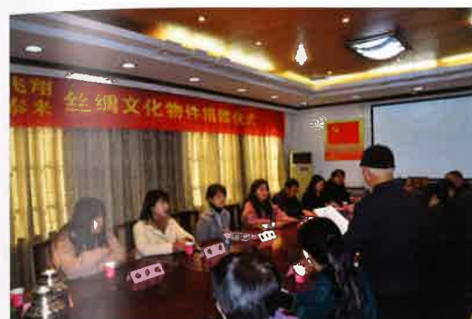
飞翔泰来丝绸文化物件捐赠仪式

民间捐赠是博物馆收藏的重要补充，也是衡量博物馆社会影响力的重要标准之一，对于博物馆的发展具有深远意义。捐赠者以极大的热情、诚挚的信念，参与到文博事业的建设中来，将激励更多的收藏爱好者踊跃参与藏品捐赠，共同保护文物遗存。本年度，吴江博物馆共接收捐赠58件。