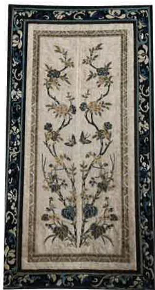
清 打籽绣草虫纹挽袖