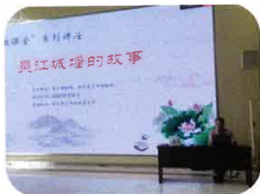
马老师作讲座《吴江城墙的故事》