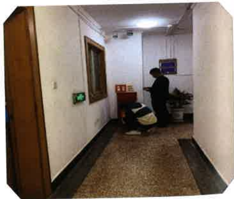
安全防范设施、消防设施检查