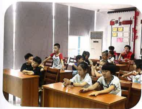
同学们积极参与学习

活动中，以《枫桥夜泊》为开头，倪老师使用唐调吟诵的方式为大家展示特殊的吟诵方法，同时老师采用另外的唐调展示了七言的《望天门山》和四言的《关雎》，同学们在老师的指导下学习用唐调吟诵的方式诵读古诗，最后，老师给同学们拓展讲解了五言的《迢迢牵牛星》和《春江花月夜》，让同学们对于唐调吟诵的诵读有更多的了解。