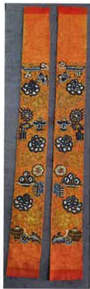
清 橘色地盘金打籽绣清供纹挽袖