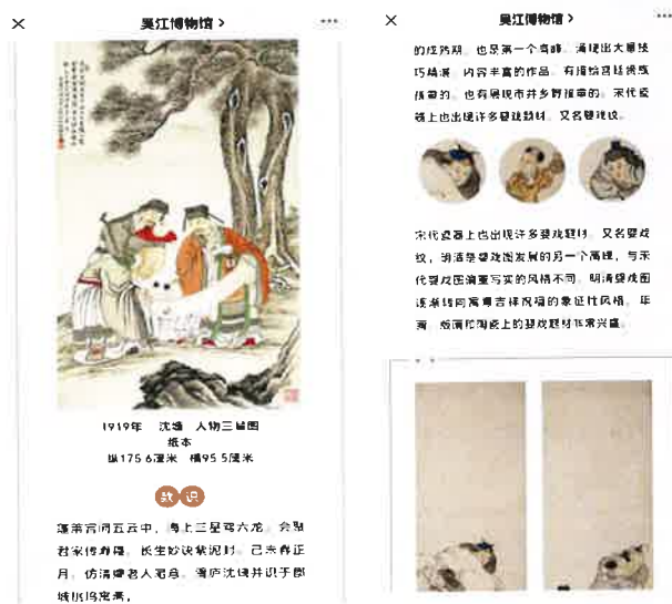
吉祥如意——吴江博物馆馆藏祥瑞主题文物展

1、吉祥如意——吴江博物馆馆藏祥瑞主题文物展（1-4期） “普天开远景，大地转新机”，在喜迎新春之际，吴江博物馆特别遴选一批馆藏祥瑞主题文物，推出线上特展：“吉祥如意——吴江博物馆馆藏祥瑞主题文物展”共四期，分别为祥瑞书画展、祥瑞书法展、祥瑞玉器展、祥瑞杂件展。