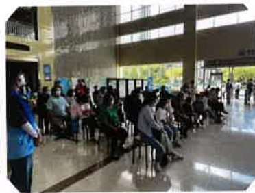
市民和学生们倾听讲座

2022年9月24日，由吴江博物馆和苏州青少年科技馆联合举办的“科博微课堂”系列讲座在青少年科技馆开展。