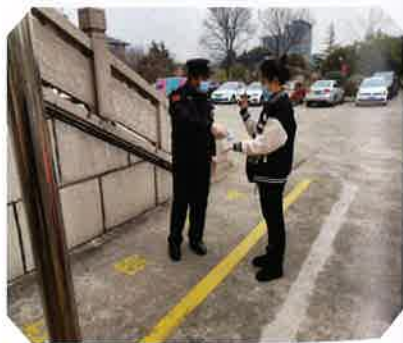
进馆前测温、查验健康码