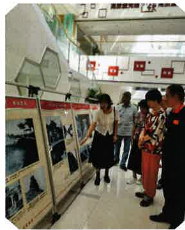
在湖滨华城社区为居民讲解《鲈乡风韵——吴江老照片展》