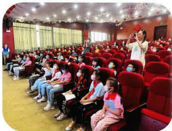
吴江区八坼小学学生聆听讲座