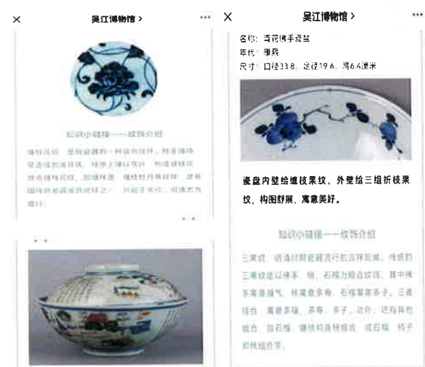
枫江瓷韵——吴江博物馆馆藏明清瓷器展

2、枫江瓷韵——吴江博物馆馆藏明清瓷器展（1-5期） 明清时代是我国瓷器发展史上的极盛时期，这一时期的民窑瓷器，不仅品种繁多、产量巨大，纹饰也复杂多样。近年来，我馆对馆藏瓷器进行了整理和研究，特别推出馆藏瓷器线上展览：“枫江瓷韵——吴江博物馆馆藏明清瓷器展”共五期，旨在使广大观众欣赏瓷器的神韵之余，更能感受到瓷器蕴涵的深厚文化内涵。