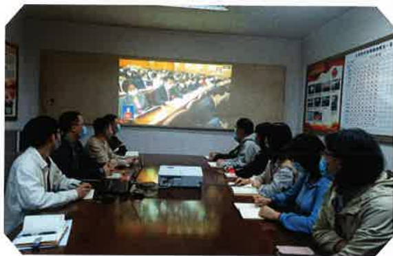
组织收看二十大报告

根据局党委党建工作要求，以习近平新时代中国特色社会主义思想为指导，深入学习贯彻党的十九大、十九届历次全会和党的二十大精神，深入贯彻习近平总书记重要讲话精神；以苏州湾博物馆建设为契机推动吴江文博事业新发展。严格落实“三会一课”；开展基层党组织生活会和民主评议党员工作；组织党员冬训学习，组织动员党员在疫情防控工作中充分发挥先锋模范作用；召开支委会议10次，支部党员大会3次，党课学习1次，开展主题党日活动共5场，深入学习政治理论知识，学习先进典型；建设“博物润心”党建品牌，推动党建和业务深度融合；走进吴江武警中队，开展双拥慰问活动；做好退休职工的节日慰问；动员团员青年积极参与各类学习活动。