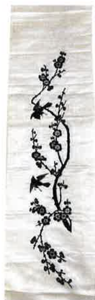
民国 墨绣梅花纹挽袖